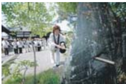
吉祥寺（愛媛県西条市氷見乙1048）

成就石とは本堂付近から目を閉じて杖を持って石が置いてある場所まで歩いて行き、石に開いてある穴（直径約30cm）に杖を突き通すと願いが叶うといわれています。一度チャレンジしてみたいかかでしょうか。 [折本隼太]